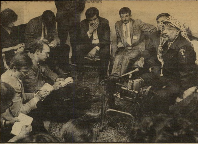
ערפאת במסיבת-הדיעותונאים למה ציפו העיתונאים?

והדבר השני: אני רוצה לקחת איתי שני קורבנות של האינתיפאדה — יהודי ופלסטיני — לשבועיים לניו-יורק,