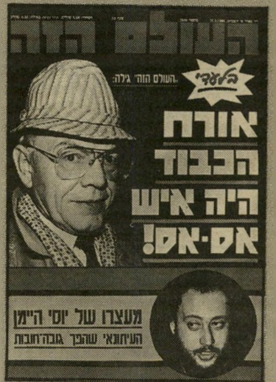
שער הגליון האחרון

נשיא-אוסטריה היה קצין בצבא הגרמני — הצבא הסדיר, הוורמאכט — ולא בעוצבה של האסאס. איש לא טען שהיה נאצי גדול. ברור כי לא ביצע שום פשעי-מלחמה. הוא בסך-הכל הע' לים את השרות שלו בעוצבות שסקו במילחמה האכזרית בפרסונים בבלקנים. על כך יצא הקצף, מדינת-ישראל אינה משגרת שגריר לאוסטריה, והעולם היהודי כולו רעש.