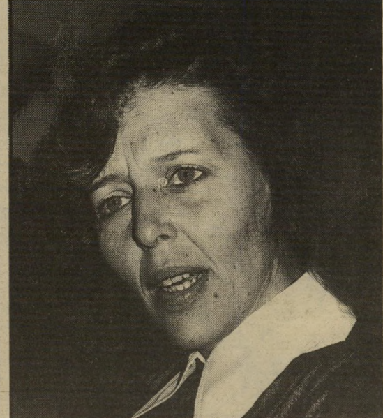
פרקליטה עדנה ארבל, אני חושבת שנופצתי...