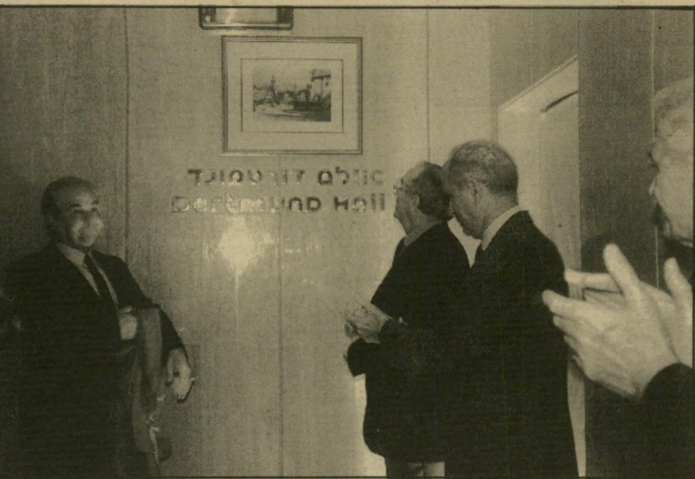
אלרואי זאמטלבה בטכס חנוכת אולם דורטמונד, נרבקתי בשימחה ובהתלהבות של האידאולוגיה הנאצית.

להיות קצין. במשך כל המלחמה לא ידעתי על הדברים שעשו ליהודים. לא ראיתי דבר. רק אחרי המלחמה, כש' הייתי במחנה-שבויים בירי האמריק' אים, הם הראו לי תמונות. הייתי בה' לם". זה די תמוה, בהתחשב בעובדה ש-י' חידית הוואפן-אס"א ראגו לאספקת יריים עובדות מקרב היושבים במתנות-הריכוז, היו במגע רצוף עם האוכלוסיה בשטחים הכבושים והיו אמונים על האידאולוגיה הנאצית. הוואפן-אס"