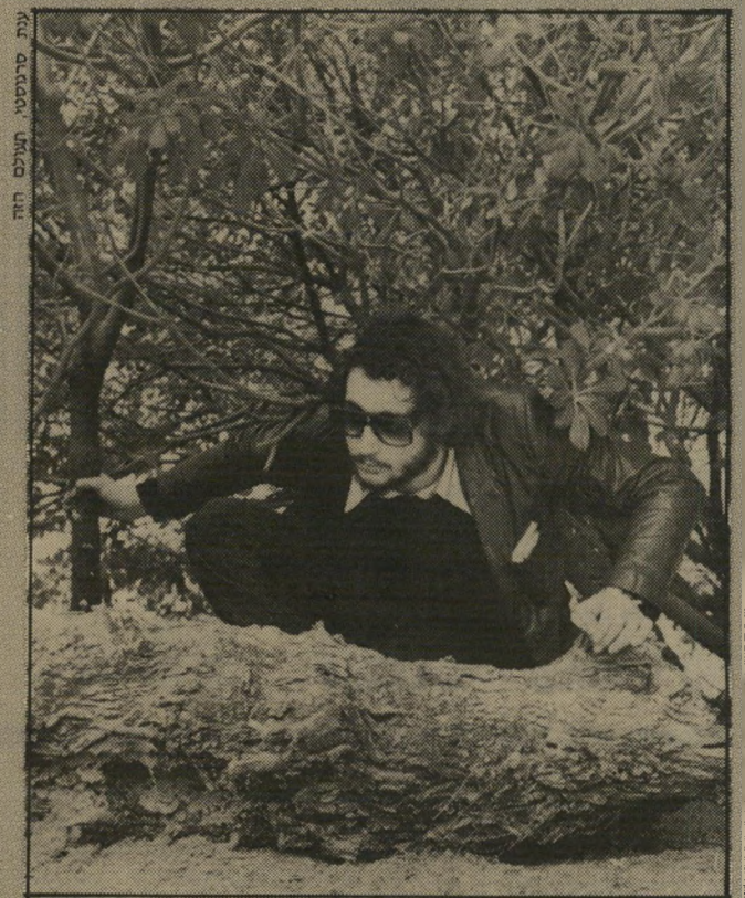
שיחזור: היימן מגלה את העקבות