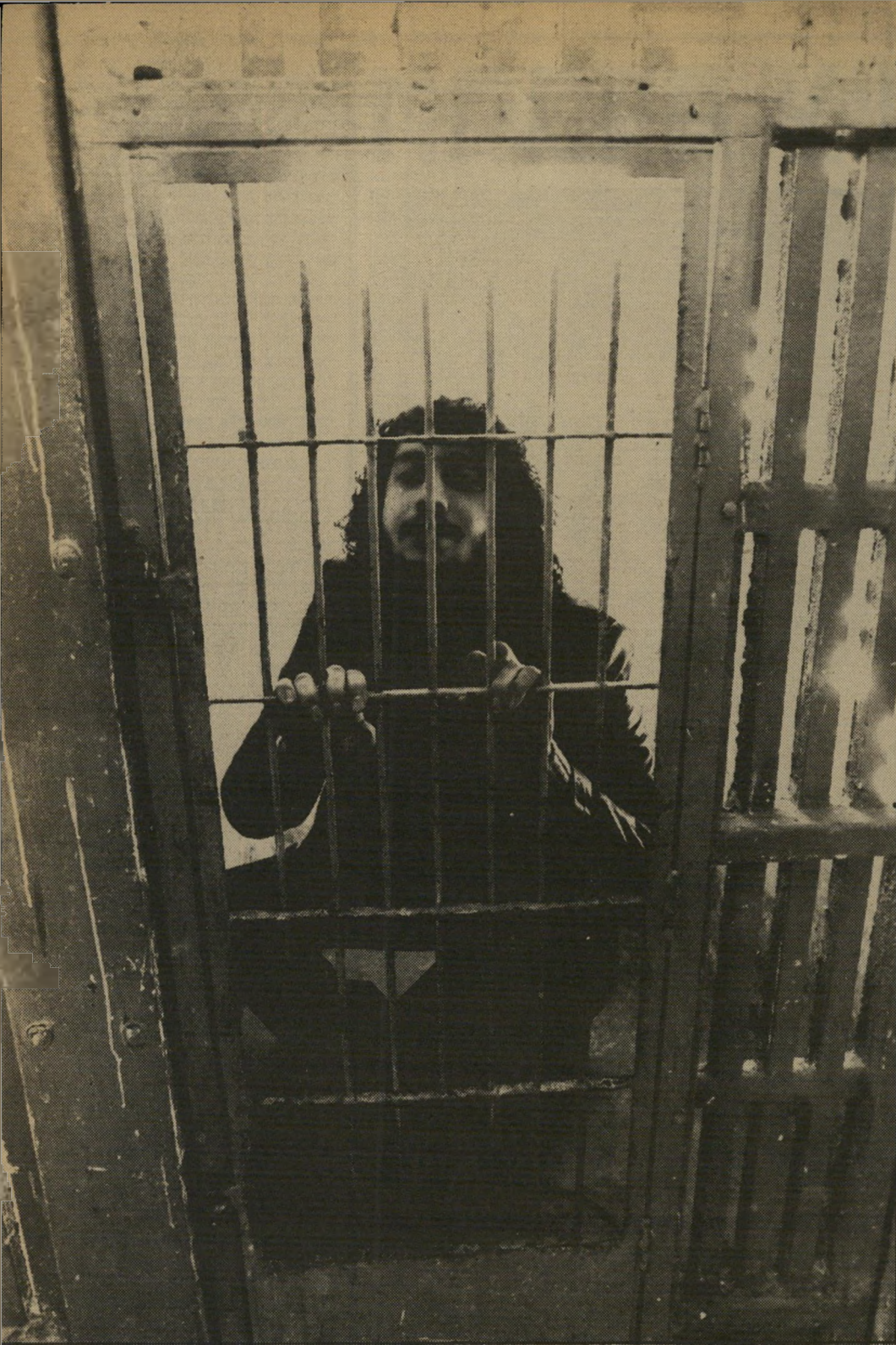
שיחזור: היימן מדגים את סבל החיות בכלוב

יוסי היימן התחיל בקאריירה העיתונאית שלו במערב, העולם הזה. תוך זמן קצר התגלה ככתב סלילי מעולה. אולם תוך כדי עבודתו התחיל להעריץ את ראשי העולם התחתון, ובעיקר את שמוניה אנג'לי, שנידון לתקופת-מעצר ארוכות. היימן נסה להימנע מחסותם של עבריינים אלה. בין השאר הצטיין היימן בשיחזור משעים, ולא אחת צולם על-ידי צלמי "העולם הזה" בשיחזורים רציניים, וגם היתוליים. כמה מתצלומים אלה, שבהם מתבטא גם הרשעה-מור שלו, מתפרסמים בעמוד זה. עם היווסד הצהרן, "הרשות" עבר היימן לעיתון זה, ושם מילא את אותו התפקיד.