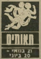
תאומים 21 ביוני - 20 ביולי

נכם בנויים להתעסק רק בדבר אחד. כדי להרגיש טוב אתם חייבים זמן לעצמכם.