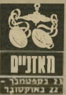
אזניים 21 בספטמבר - 22 באוקטובר

22 ו-23 יהיו מאוד מעניקים וכבדים. יש לכם יותר מדי עבודה, ומציקים לכם ומתעורבים בכל דבר שאתם עושים. כל המצב מוריד מאוד את המור סיבציה. הבריאות אינה על הגובה. אתם נוטים לחלות בשפעות, סובלים מחוס וחורים לילדים יצטרפו לשנות תוכניות בגלל מחלות ילדים, העלולות לרתק אותם למוטה. בענייני כספים משוה מתחיל לזוז. עכשיו יהיה קל יותר. סכום-כסף יגיע כנראה מבין מי שפחה.