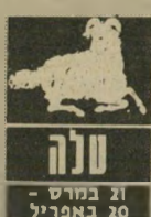
טלה 21 במרץ - 20 באפריל

בעיות בריאות יציקו לכם בתקופה הקרובה. מחלות, שכמעט שכחתם על קיומן, שבות ומציקות. צריך לטפל ולהיפטר מהן. אתם חשים עייפות גדולה ומתקשים למצוא זמן למנוחה. ה-23 עד ה-25 אינם נוחים, בייחוד ביחסים עם בני הזוג ועם הסובבים. הם מאיישים אתכם בהאשמות לא-צודקיות, וזה חוזר על עצמו במקום-העבודה. בשטח הרומנטי - הצגת אדי-שות תקרב את יש שבהם אתם מעוניינים.