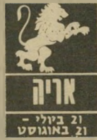
אריה 21 ביולי - 21 באוגוסט

למי שנולדו מה-15 באוגוסט צפויה תקופה של פריחה בעבודה, הצעות מחמיאות, דיברי הערכה ותמקי-דים שיש בהם אישור לאמון שנותנים בהם. השתלמות או לימודים בתחום כלשהו מלמדים על כישוריות שלא ידע-תם עליהם. למי שנולדו לפני תאריך זה יש מצב-רוח קודר. אינכם מרגישים כל כך טוב, ואתם נאלצים לבעוט בגלל עניינים כספיים. דלי ותאומים נמ-שכים אליכם ואף מתאימים לתקופה זו.