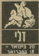
דלי 20 בינואר - 18 בפברואר

ענייני כספים ורכוש מטרידים אתכם. זה לא אופייני לכם. אבל כעת תוכלו להפעיל כוח, להיות תקיפים ולקחת מה שמגיע לכם. על פי רוב אתם מנותצים, אבל עכשיו מצבכם לא כל כך טוב מהבחינה הכספית. יש לכם כושר-שינוע מצויני ו-בתקופה זו אין ספק שכל אחד יאזין למה שיש לכם להגיד. מיבחינים או מיבחיני-נחיצה יביאו לתוצאות משמחות. מהתחום הרומנטי יהנו בעיקר מי שנולדו בסוף מזל דלי.