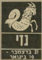
גדי 21 בדצמבר - 19 בינואר

התיקשורת שלכם עם הסביבה משתפרת. עכשיו חובלו להסביר את עצמכם ולהגיש דברים שקורם לכן היו נעולים לפניהם. מסיבות אלו חשבוים יהיו חשופים עכשיו. אהם מרגישים צדך לשנות סביבה, להכיר אנשים חדשים ולהתאחד רר. ענייני כספים עדיין המרינים, אם כי ברור שיד המיקרה תבוא לעורכתם, וחובלו לצאת מכל קושיו. בעניין מערים חובלו להר