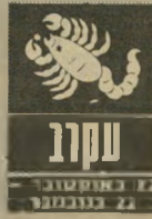
סקרן 22 באוקטובר - 21 בנובמבר

עיפות וסבל כבעיות ארניה ואסמסה עד ה-26 בחודש. אחר כך מתחילה תקופה יותר קלה. היצירותיות חזקה, והאמונים שבויכם יהו מזה בסיוח. גם האחרים יזכחו את עצמם בעבודה ויזכו לתנאים טובים יותר, ואולי גם להעלאה במשכורת או לכספים שיעשו אחר ציפיה ארוכה. קשרים עם מכרים בחו"ל פתוחים. בתחום הרומנטי יותר טוב מתחילה תקופה שבה כל אחד יוכל לבחור לו את סוג הקשר הרצוי לו. הפין השני נמשך אליכם.