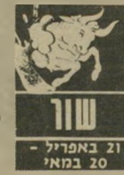
שור 21 באפריל - 20 במאי

דגש רב מושם בימים אלה על מקום-העבודה. אתם זוכים להערכה מצד הבוס, המעמיתים של עבודתם וכל מי שעוים אתכם באים במגע. עכשיו תוכלו להתקדם בקצב הרצוי. יבואו לקראתכם ויציעו הצעות מושכות. לא ברור לכם אם כדאי ל-בצע שינוי שיגרוד-תר-ספת אחריות ויתור על זמן פני. כדאי לשקול היסב. אל תשכחו שאי-נכם בנויים להתעסק רק בדבר אחד. כדי להרגיש טוב אתם חייבים זמן לעצמכם.