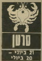
סרטן 21 ביוני - 20 ביולי

אחרי כל הקשיים שעברתם בחודש האחרון עכשיו יהיה קל יותר. ובכל זאת הדין והדא אינם נוחים. שוב מתחוח בבית, משהו זקוק לעורכתם. אבל הפעם זה עבור מהר יותר. מי שלא נסע לחו"ל, ובאלה יש רבים, שיתכונן לביקור מחו"ל או לחידוש קשר עם מישהו שבא משם. ה-26 וה-27 מציעים לכם אפשרויות בתחום הרומנטי. עכשיו כדאי להרבות בנסיעות. חובלו להיפגש עם אנשים סמוינים ואף לפתוח בפרויקט-אהבה חדשות. שיפור בענייני כספים.