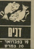
דגים 19 בפברואר - 20 במרץ

מי שנולדו בשבוע הראשון של המזל וחוננו כבר את יום הולדתו יחשו טוב יותר. האחרים עדיין סובלים מסמוקה ובריאות לא טובה. התלבטות בין עני קשרים מקשה עליכם. אינכם שלמים עם מה שאתם עושים ובמי שלא תבחרו ההרגשה חיה שבצמם אתם מתגעגעים לשני. כרגע לא נראה פיתרון לבעיה. בקרוב חוצץ אפשרות נוספת, וזה חושי-שיכרע, כנראה, נסיעות, קניית מכונית ועסקות נראות עכשיו מוצלחות. צריך בכל זאת להקפיד עם מי יש לכם עסק.