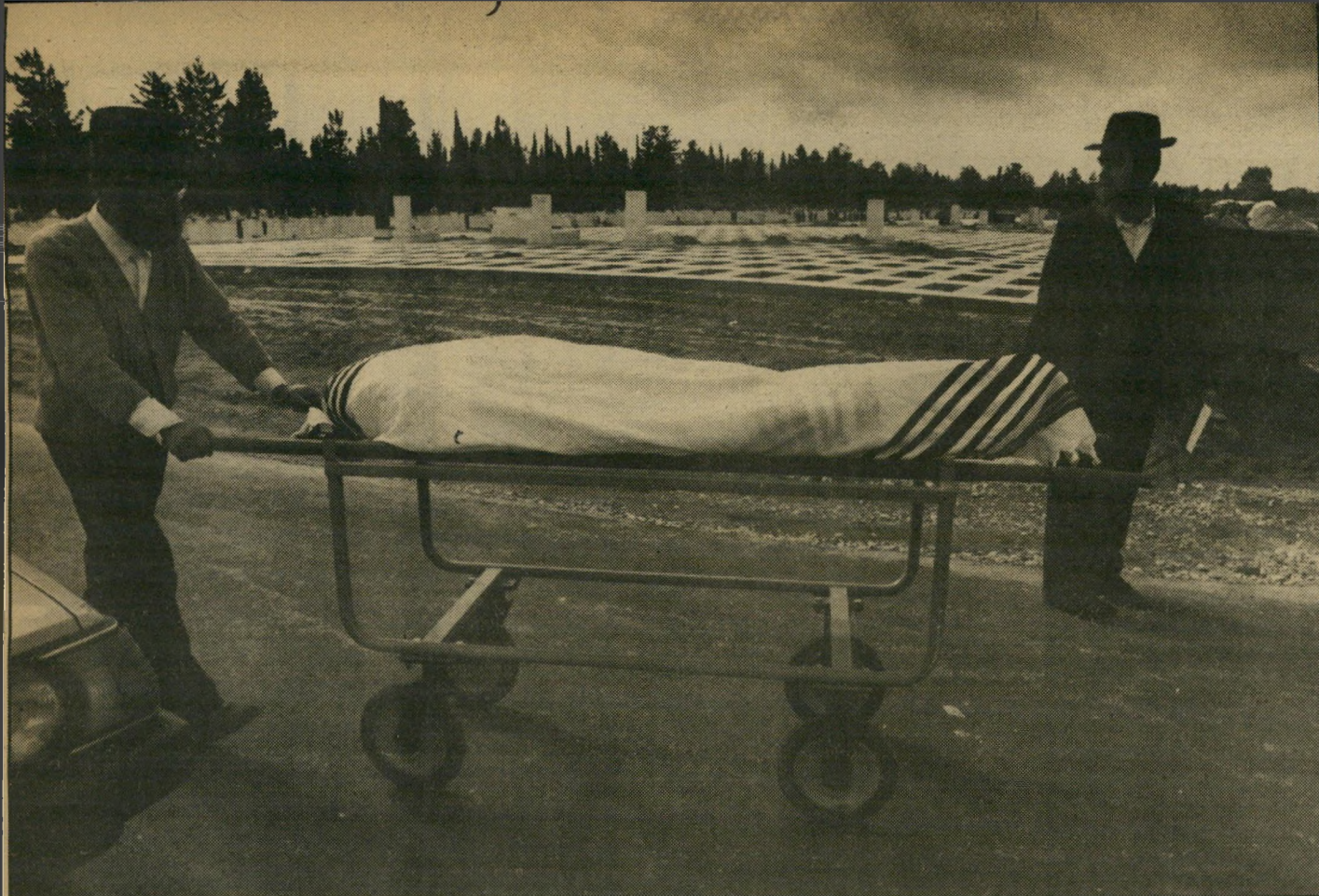
בירו הרבנים: הגופה על האלונקה הלווייה דתית

אותו אדם סיפר לקרוי כי אירגונו הוא שיזם את המהפכה הרוסית ב-1917, עמד מאחורי היטלר ואין לו כל קושי לשבש מהלכים בעולם, מכיוון