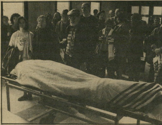
האם זהבת ליר הגופה ראשים מסוכים