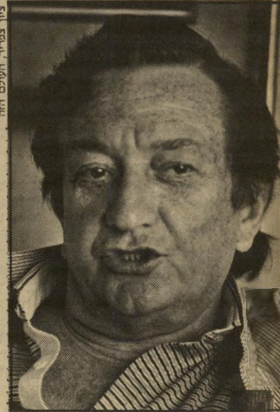
ציון צמיר, העולם הזה

משולם ריקלים מכר את חברת התמרוקים פברז'ה ב-1.5 מיליארד דולר לחברה ההולנדית הענקית יונילבר. ריקלים החזיק בחברה באופן פרטי, והוא קנה אותה לפני כמה שנים במח