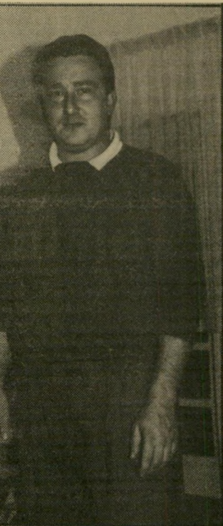
סטודנט שנהב, נמאס מהמונמיוס"

הפרופסור מירון: "לשאלונים אין כל ערך, כי הם לא ישפרו את ההוראה.