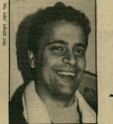
סטודנט נהוראי צריך להחתיים את הסטודנטים!

הפרופסור אוריאל רייכמן, דיקן הפקולטה למישפטים, מעריך את הסקר כטוב: "השנה הפסקנו את הסקר הפנימי שלנו, ואנחנו משתמשים בסקר של האגודה. בפקולטה למישפטים הסקר הוא בעל חשיבות רבה. מורה מהחוק, שציוניו אינם די טובים, העסקתו מופ' סת. מרצים ללא קביעות לא יקבלו קביעות אם ציוניהם אינם משיביעים את הרעת. אם יש קביעות, הסנקציה היחידה שנתרה היא להעביר את המר' צה משיעורי-חובה לשיעורי-בחירה."