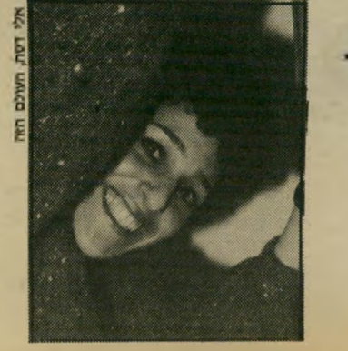
סטודנטית אהרוני נרשמת למרצים בעלי ציונים נבוכים

רזניה! אברהם לומדת מדעי-המדינה. לפעמים יש לי הרגשה שבי-אנונירסיטה שכחו שהמרצים הם לא רק חוקרים, ושעליהם ללמד מדי פעם. יש לי מרצים שהם פשוט זועתיים. מקריאים מהדף, והגרוע זה שהם מרמים את עצמם — אם הם לא מסוגלים להרצות, או לפחות שיקריאו מהדף שלהם בקצב הכתבה. אבל הם מרגי' שים, כאילו מרצים' כשהם מקריאים מהדף.