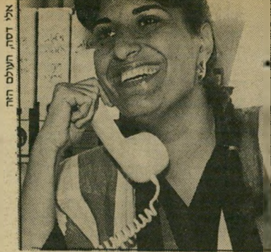
מרכזת-סקר שמשווייקשה זה משקף

המרצים, בדרך כלל, נבוכים, ושואלים אם הם צריכים לצאת. יש גם מי שמת' לוצצים: אתם חושבים שזה אנונימי, אבל חכו עד שתראו את הציונים שתקבלו" או "למה באת רווקא אחרי הבחון?"