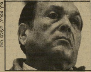
מודעי מרץ מרוכז

יצחק מודעי התבטא בקיצוניות על עתידה של טאבה, יצחק מודעי התבטא בשנינות בעת ישיבת-הקאביי נט האחרונה, מודעי פה, מודעי שם. מכיוון שרק לפני שבועיים בקושי שוחח השר (המופקר על הכלכלה,