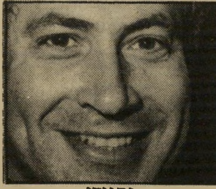
נתניהו לא מבינים אותו

"אין לנו אורח כזה!" נעניתי בפסקנות אחרי חיפוש מדוקדק.