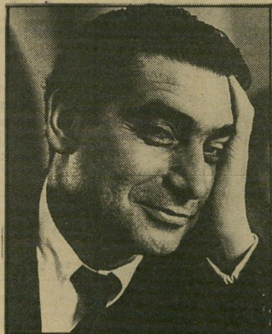
רוברת קאפה, פאריס, 1951

עתה, משהועמתי על סעוטי, אני ממחר להודות בה ולהביע את צערי על שלפחות במיקרה זה נתתי גם אני את ידי לאלה המרחיקים גאולה מן העולם.