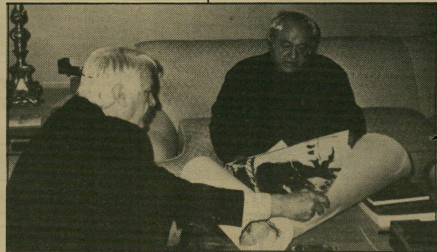
יגאל תומרקין מראה את המיטווים לשר-התרבות הספרדי, חורחה סמפרון

נוכחי כאן רק את שמותיהם של לואי אראגון, ברט ברכט, ג'ון דוס פאטוס, איליה ארנבורג, ז'ורז' ברנאנוס, אנרי מאלרו, רפאל אלברטי, אגון אר' וויין קיש, ארתור קסטלר, סטיון ספנדר, ג'ורג' אורוול, ארנסט מינגוויי (לם) צ'ילצלו הפענר (נים), מלקולם לאורי, והגרמני לורוויג רן, אף הוא לוחם בצד הרפובליקאי. וכמוכן - את חורחה סמפרון עצמו, שהיה נער כימי המילחמה (הוא יליד 1923) והיגר מספרד לצרפת לאחר התבוסה בחברת הוריו. בצרפת, אגב, הצטרף למחתרת ה'אנטי-נאצית', נתפס ונשלח לבוכנוואלד. ובשנים האחרונות הוציא ספר ובו הוא מותח ביקורת קשה