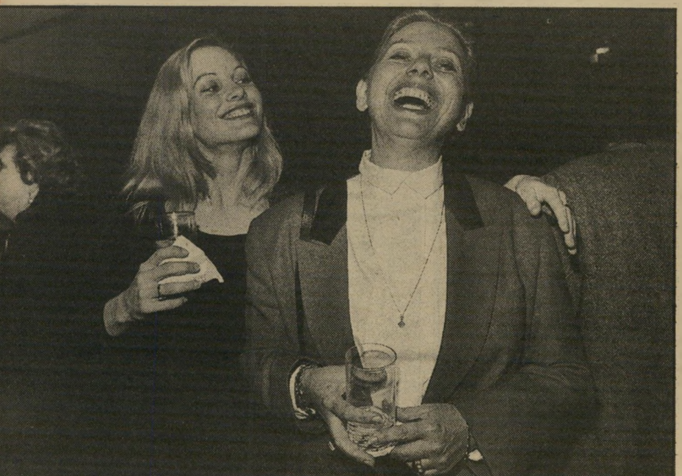
יפהיה בלונדית בנוסח שנות ה-40, הופיעה באח"רונה בסירטה של גילה אלמגור, הקיץ של אביה". האם פגשה בקולגות והבת פגשה בחברים למיקצוע.

שחקנית הקולנוע שירלי מקליין, אחותו של וורן ביטי, הגיעה ארצה לבכורה סירטה מאדאם סוזאקקה. הני הלת מלון הילטון וחברת סירטי שפירא החליטו לערוך לה מסיבת-קוקטייל ו להכיר לה את האנשים החשובים בת"חומים השונים של התיקשורת, החברה