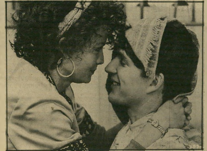
שחקנים מודין ופיפר בסרט „נשואה למאסיה“ שפע של רעיונות קולנועיים

מאדים סוזאצקה (צפון), תל-אביב, בריטניה) - שירלי מקליין במיטבה כמורה לפסנתר הרואה לעצ' מה כיעוד ללמד את תלמידיה לא רק מוסיקה, כי אם גם דרדחיים. רק למי ענה של מקליין כדאי לראות את סר' זאצקה.