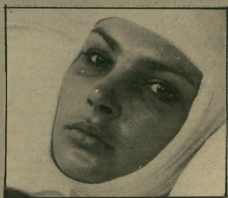
אנה דימנה - ניצחון האהבה

הסיפור המקביל עוסק ביתומה נאה המוכרת סיגריות בקווסק של הכפר, ובבן-האצילים המפלר' סט איתה. מונדקאי גס-רוח מנסה לעמוד בניניהם.