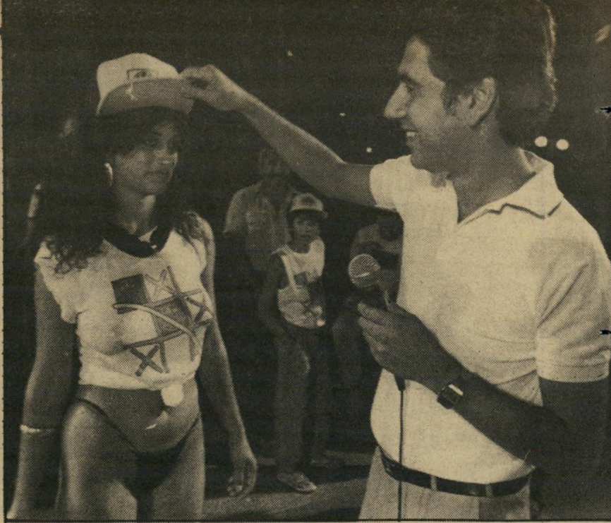
ראשיעירייה הוכמן (1984) האם הייתי קונה ממנו מכונית משומשת?

נשים לפעול כצונם. הוא איפשר לא נשים לנהל חופים פרטיים. אבי לא נתן זאת, כי זה דורש אומץ. אבי הוא איש קאריירה. הוא רוצה כוח. הוא לא מעוניין באילת כקהילה. הוא רוצה להיות ראשיעיר כדי לשלוט. הוא שיכור כוח. כשנשאל לרעתו עלייך שאביו קרא לרשימתו בשם "אבא", אמר: "זה חלק מהציניות שלו, הניסיון לעוות את האמת. הוא מציג את החולשות שלו כעוצמה. הוא אדם ציני, המנצל אנשים לטובתו, ללא כל שיקולים מוסריים. בבחירות האלה הוא הימר על חייו. אם יפסיד, הוא ילך לחפש עבודה במיקצוע שלו."