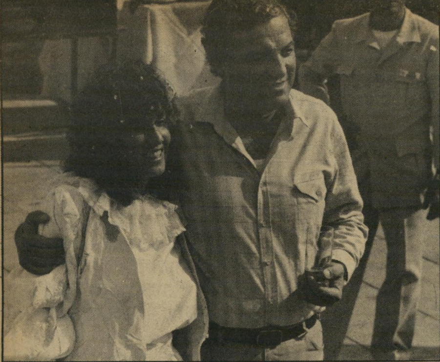
ראשיעירייה לשעבר בן (1983) היום הוא בא כדי להרוס, להחריב ולנקום!