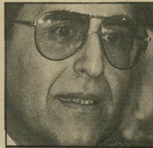
שחל לוטש עין