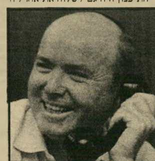
לורברבוים מי קילקל?

לורברבוים חובשי-הכיפה נחשב כאיש של זבולון המר, ועליכן קיוו הבוחשים לתמיכת הרתיים בו מחר, ולתמיכת ארצה רדעי יש אומרים: שתול של המערך כש"ס מצד שני. התיכנון היה גם לשלוח את אהרל'ה