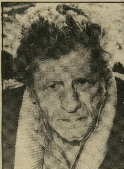
אח מתי מגד