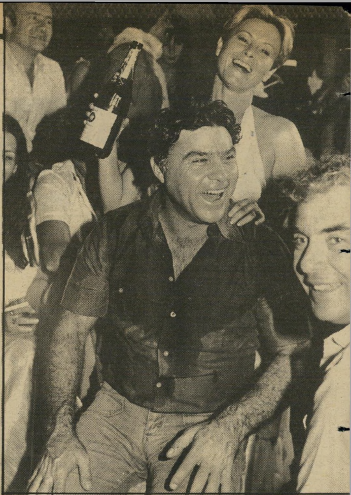
אלי ואביה פשושדו עבדה, עבדה ולא זכתה להיכנסו

הברדן מר את ראשו בין ידיו וביקש פשוט להי-עלם. כל החוף תפס עניין במתרחש. הגמל נראה במשך שעה ניסה הברדן להתאושש מהתקריט.