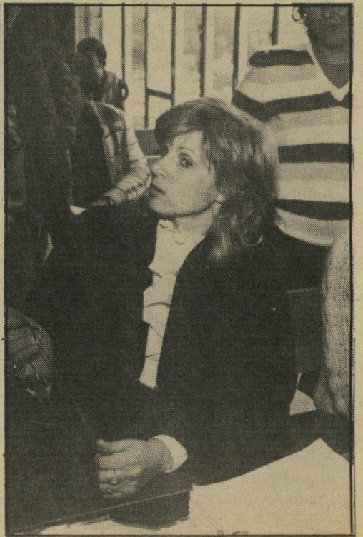
תובעת אחיטוב, כי היא פריקית כזאת"