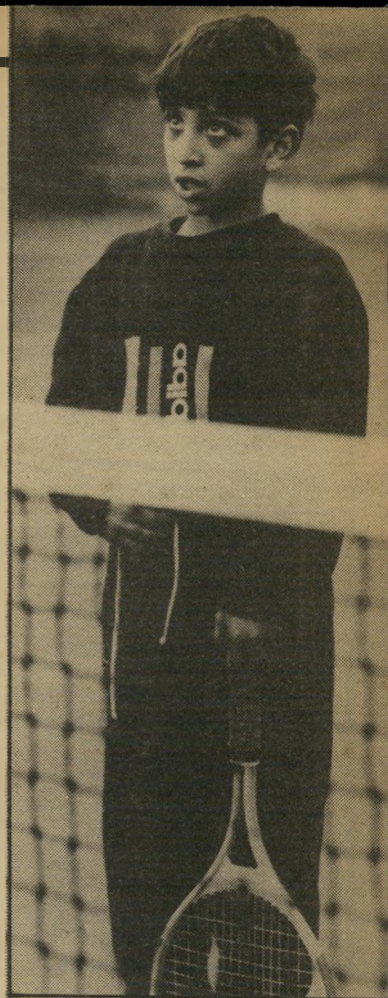
רדני אמר שהיא ילדה משונעת

יום אחריכך נישאה וילדה את אילנה, כשהיא בת 40. נהוג לערוך לנשים הרוות בגיל כזה בדיקת מיישפיר, כדי לברוק את כריי אות העובר. לי לא ערכו בדיקת מיי שפיר, ולא ידעתי שתיוולד לי ילדה החולה במחלה הזו, אומרת האם. מיד אחרי הלידה הוסברה לה ה מחלה והדרכים לטפל בה ולחיות עיר מה. כאשר חינוך ותיקה היא החליטה להתמודד עם הבעייה, מבלי לערב מוסדות ומבלי שהעלתה כלל על דעי תה להשאיר את הטיפול בכתה בירי אחרים.