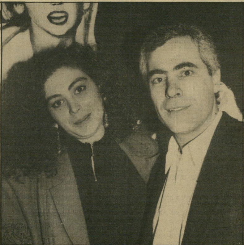
סימ ברישישית ומשה בובליל להמיס את כולם לניו-יורק

אני כלל לא הבנתי את כל העניין הזה, אבל אם כבר דריקרב, אז הייתי בוחרת להילחם ב- שימעונה שזוריץ על אלי פפושדו , או ש-הייתי נלחמת על אלי הורביץ . ואם כבר בתחום המזון, אז הייתי נלחמת על מיקי שטרואס .