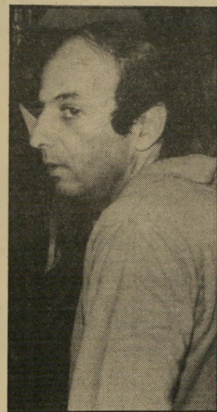
מנהל-אישי מזור הייתי מוותר על גלי”

פשוט לא מבין למה גברי מזור כל-כך נגד גלי, ומדוע הוא מנסה להזיק לה כל-כך. יכול להיות שהוא סתם שונא אותה, או שקשה לו לפרגן לבחורה שמצליחה כל-כך. גם העיתונאי איציק יושע בדיעווח אחרונות מפנק בכתבותיו רק את ירדנה ארוז, ומקפח את גלי עטרי. בכל שבוע מופיעים ידיעות וסיפורים על ירדנה, אך הוא מתעלם בכוונה מגלי. יושע כתב בעבר על גלי, אך אחרי שקראתי את מה שהוא כתב הגעתי למסקנה שאני לא רוצה ממנו שום