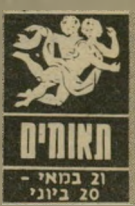
תאומים 21 במאי - 20 ביוני

ב'1 או ב'2 בחודש צפויים שיוניים במקום הסוד-רים. יתכן שתצטרכו להשקיע כספים בחיפון או בחיפון חיוני שהתקלקל או שתחליטו לרכוש רהים או פריים אחר לבית. אין זה ב-דיוק הזמן הובן. וסו לר-חות זאת לשבוע הבא. כי מקום-העבודה אתם מח-יילים לחפש איזה שיוני בקרוב צפוי שיוני תשוב וחיובי. כרגע אין זה רצוי לבצע שיוניים, אך בעוד-חודשים יפתחו לעליכם דלתות חדשות. ב'5 וב'6 בחודש אתם עלולים לא להרגיש טוב. הקפידו על מה שאחם אוכלים.