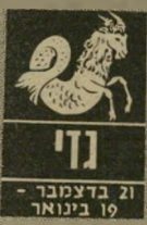
גדי 21 בדצמבר - 19 בינואר

מצבכם הכספי אינו נוח. יתכן שלקחתם על עצמ-כם יותר מדי התחייבויות וזה מפחיד אתכם. אין לכם ספה לחשוש. כרונו זה וראה מפחיד אבל גם המקושי הוא תצאו בקרוב ותיוכחו לראות שאפשר להיות גם עם העול הנוסף שלקחתם על עצמכם. ישו ושבת יהיו די מכבי-דים וקשים, מזהר/אויר ר מצב/הרוח יהיו אפורים מ-די. אל תצפו עכשיו לחי-דועש קשרים, גם אם ידירים מעבירים לכם ידיעות ומסרים מהאובייקט עצמו. המטר כפול ויש סכנה שתגעו מעצמכם צחוק.