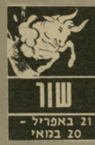
שור 21 באפריל - 20 במאי

הזו והז' בחודש עשויים להעמיד אתכם לפני הוצאות כספיות גדולות משתבטם. תוכלו ל-צאת מזה בזכות עזרה ש-תקבלו מידידים או קרובי-משפחה. הרי בחודש לא יהיה קל. מצד אחד תפגשו באנשים שחברתם אהובה עליכם, אך זה יביא לסצי-נת קינאה ולריב עם כך-הונו. שיוניים במיבנה או ב-מיסגרת משותפת צפויים בקרוב. בחחום העבודה אתם עומדים לפני קידום. אתם עשויים לקבל הצעות מושכות. אך תצטרכו לקחת יוזמה. אל תחכו שהדברים ייעו מעצמם.