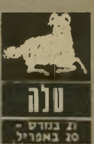
טלה 21 במרץ - 20 באפריל

נסיעות שתוכננו ל-1 או ל-2 בחודש ידחו. הקאריר/ה ממשכה להעסיק אתכם. אמנם יש אפשרות להתקדם, אך נראה שזה יהיה על חשבון משהו שעיימו אתם מיוזמים בעבו-דה. כבר עכשיו מורגש מתח ביניכם וקיימת אי-יניעויות. קשה יהיה למצוא מיתרון לקוני-פליקט. אך דבר אחד יכול להנחות אתכם. עדיף שלא להחליף מקום-עבודה ותפקיד. במקום הקבוע יש יותר ביטחון ותנאי-עבודה נוחים יותר.