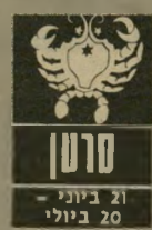
סרטן 21 ביוני - 20 ביולי