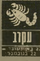
עקרב 22 באוקטובר - 22 בנובמבר

ענייני כספים יעסיקו אתכם ב-1 וב2 בחודש. יש סיכוי גבוה שתזכו לקבל סכום-כסף גבוה מזה ש-שלו ציפיתם. מאידך, קיי-מח סכנה לאבד, לשבוח או לסבול מפריצות וני-בות. שימו לב לשתי האפ-שרויות והיו זהירים. התג-רות שלכם לסביבה מאור-תוקפניות וקיצוניות. האו-רים עשויים אתם חיים או עובדים חוששים לשוחח איתכם. אתם ממהרים ל-התפרץ, להאשים ולעשות-ברוגז. נכון שבתקופה זו אתם רגישים, אך שים-רו על איפוק. כי הסביבה הקרובה קצת סובלת.