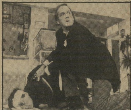
ג'ון קליז ומייקל פאלין - להציל היהלומים

זהו עוד ניצחון של ג'ון קליז, שכבר זכה להצלחה גדולה עם המלון של פולטי, סירטי מונטי פיטון ורבי-מכר שכתב על נישואיו. הוא החליט להשתמש בשרותי הבימוי של הבימאי הוותיק מייקל קריי-טון, מכיוון שלדבריו, לא היה זקוק להמצאות רעיונית, אלא למישהו שיממש את טכניקת הבימוי על הבד.