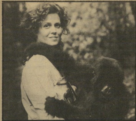
סיגורני ויבר: להציל את הגורילות

דמותה של סיגורני ויבר נתפרה לפי מידותיה של החוקרת האנתרופולוגית דיאן פוסי שבילתה את 19 שנותיה האחרונות במעקב אחרי הגורילות וב-הצלתן, ונרצחה בצורה מסתורית. מייקל אפטד, שביסס את סרטו הן על ראיונות עם אנשים שהכירו את דיאן פוסי והן על האר-