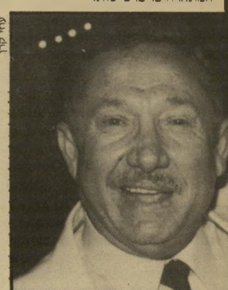
אישיעסקים עינבר יוזם עיסקות

אישיעסקים עזריאל עינבר רוגז על אישיעסקים יעקב נימרודי, המתחרה בו ברכישות.