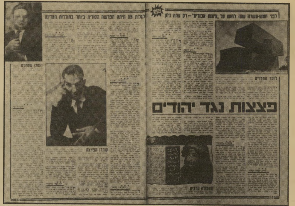
בתבת „העולם הזה“ (20.4.66) מי נתן את ההוראה?

פשוט ההוכחות היו כאלה שלא היה כל קושי להוציא פסיקדין כאלה.