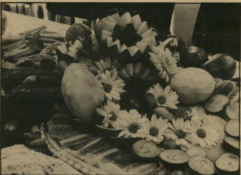
סידור שולחן פירות לט"ו בשבט אפשר לסדר אותם יפה

— אגב אוכל, ט"ו בשבט בשער. זכרו שאוכלים הרבה פירות, ותראו כמה יפה אפשר לסדר אותם. את התמונה שלחו לי ממועצת-הפירות.