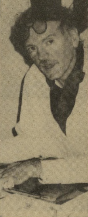
אופנאי דירנד הפריט האופנתי - מיטפחות-צוואר

אדומת-השיער יתגבר ויקבלו את מלוא תשומת-הלב שלהן הן ראיות.