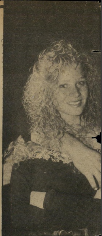
יפהיה אילתית בת 17 המבקרת בקביעות בדיסקוטק. לצידה שימחה, שאירח את סיגל וחברותיה.