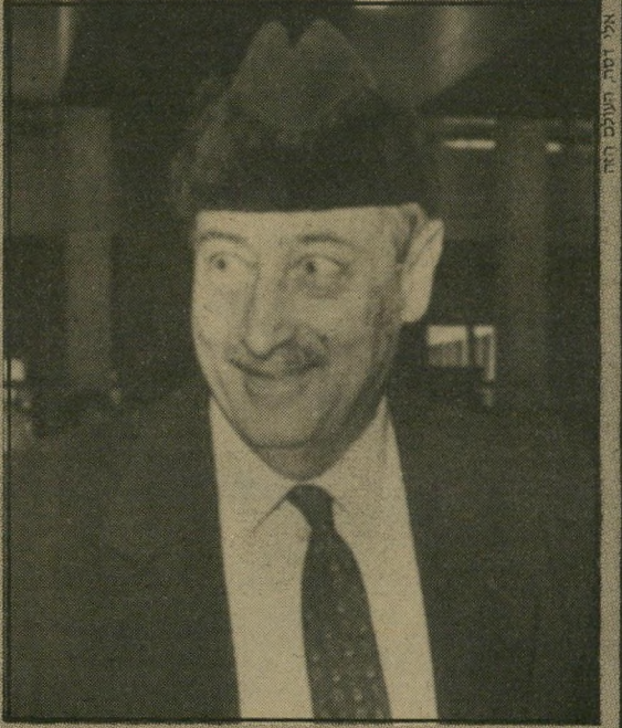
עורך הדין, חבש כובע שנקנה בארצות-הברית, בעל שולי-פרווה. הכובע, העשוי צמר משובת, הגביה במידה ניכרת את הפרק-

מאחורי פרשת-הרולארים. דובר משרתת-ישראל שוקל כעת אם להעמידו לדין על דבריו. ■ ברברה טאופר , מי שהיתה ניספחתי-העיתונות האוסטרית בארץ, התפטרה מתפקידה כמנהלת יחסי-החץ של מוס'און ישראל, והחליטה לגור בתל-אביב, מפני שזו צעירה וחיונית יותר.