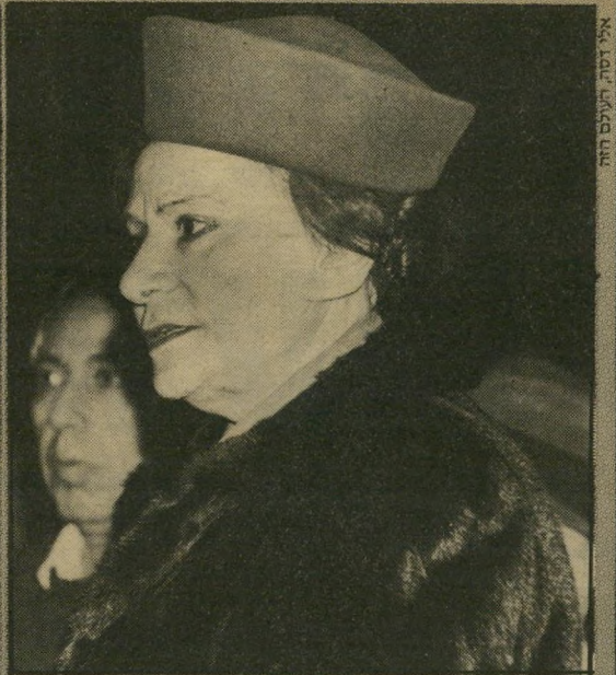
השופטת-בדימוס ומבקרת המדינה בתווה, חבשה לראש כובע לבד מודרני שהבליש את יופיה. הכובע, בצבע