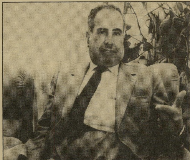
ראשי-עירייה פרייג' לחת תחמושת ליריב?

בעיני רוב הפלסטינים, הפסקת האינתיפאדה מבלי להשיג כל יעד מדיני היא מעשה מטורף. כפי שאמר ערבי פשוט השבוע בטלוויזיה הישר-אלית, לכתב גיל סדן: "אם כואב לך כל הזמן בבטן, כדאי לעשות ניתוח. זה כואב, אבל אתה יכול להירפא אחת