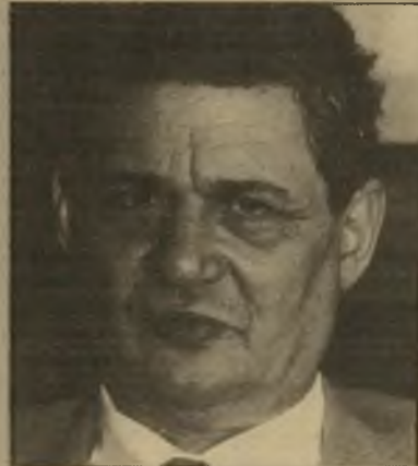
שרי-לשעבר ארידור מה אמר קיינס?

מזה זמן רב מתגבשת אצלי המחשבה כי חסר מעל עמודי העולם הזה עימות בין ריעות שונות. אמנם רואינו בשבועון אנשים רבים השייכים לימין ולמרכז, אנשים דתיים וחילוניים, וניתנה