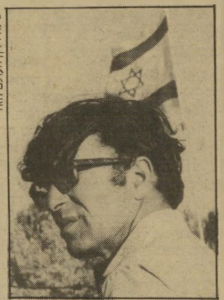
נגיד ברוני הדוח טרם פורסם

פירוק וחיסול בנק-צפון-אמריקה עלה למשלם-המיסים עד כה יותר מ-80 מיליון דולר. מכיוון שהמעשים שגרמו להתמוטטות הבנק נעשו על-ידי בעליו ומנהליו (העומדים עתה לדין, חלקם כבר הורו שזו ומרצים את עונשם) תחת עינה הפקוחה-הכביכול של המפקחת-על-הבנקים, נשאלת השאלה: היכן למשלם