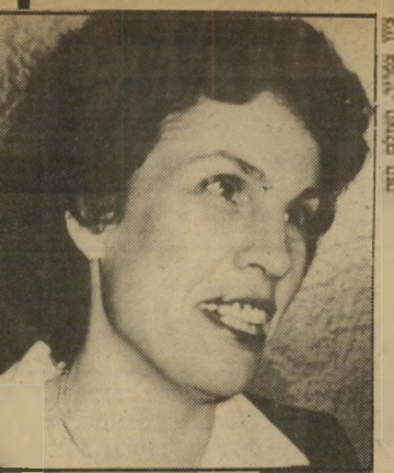
מפקחת לשעבר מאור מי אשם?

כאשר התמנה מיכאל ברקוני כגיד בנק ישראל הוא הטיל על רואה חשבון חיצוני לברוק את נושא הפיקוח של בנק ישראל. עד כה טרם פורסם הדוח.