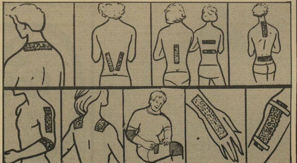
צורות השימוש בפר