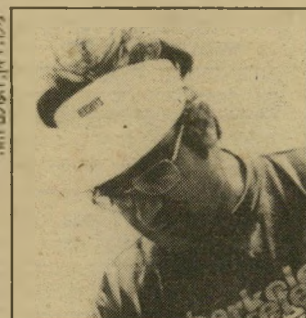
מילד ריון, תולום הוח