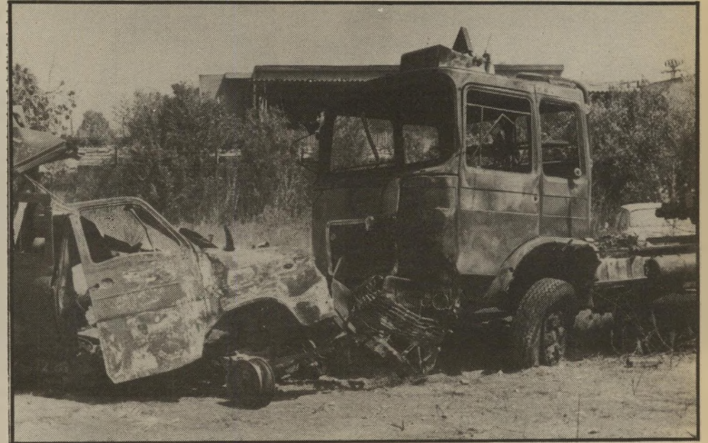
הסמטריילר הטראומה המחורץ במקום התאונה, לא הצלחתי לראות את הפנים שלהם —

זכיתי ביד? מה זה משנה? זה לפחות יתן לנו להרגיש... אבל גם ככה הילדים הלי כו.