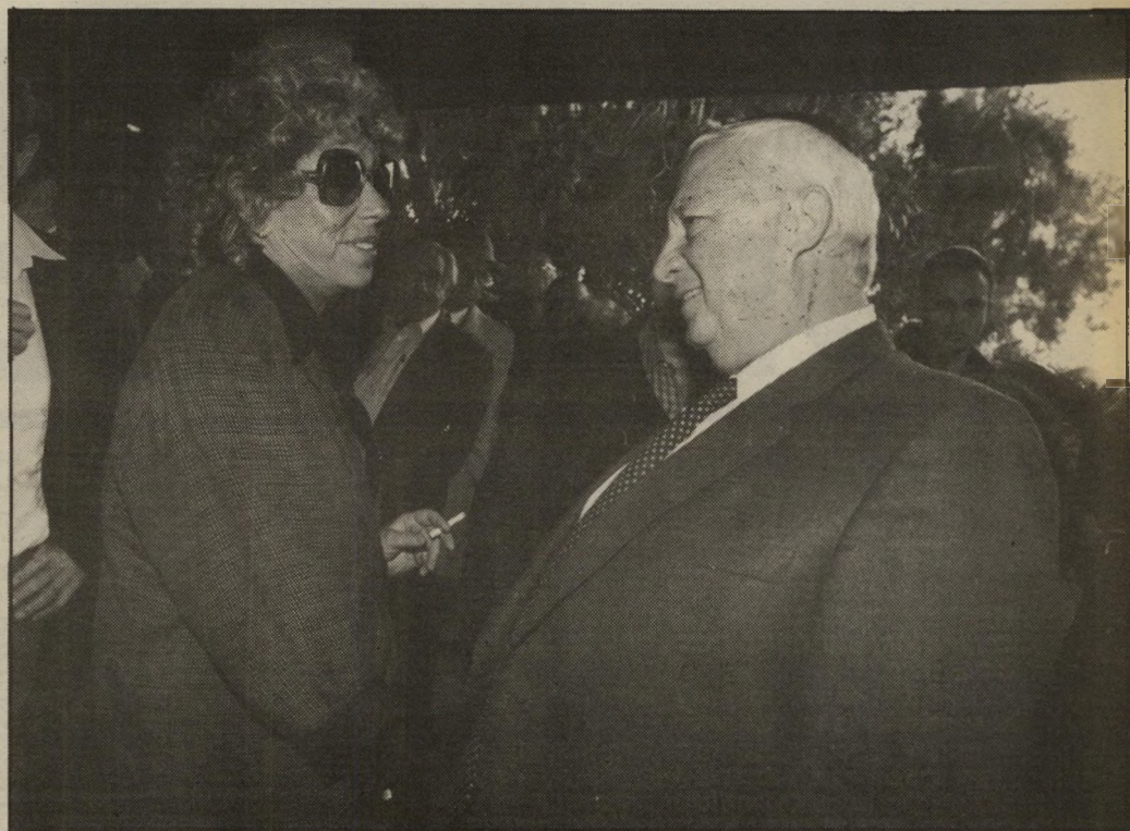
אלוני עם אריאל שרון כיפה שחורה

האמת היא שלאנשים כמונו, שאינם מצטלמים בסרטים ושאינם חושפים את גופם למצלמות, הכעס של מירי איננו ברור. אם כוידאם מוכן להצטלם כעיי