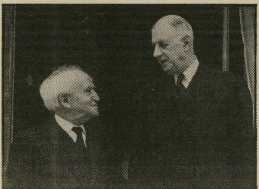
דהיגול ובניגוריון לפני האמבארנו

אני חייב לשאול שוב: איך זה שאחרי שנים של צפייה בסרטי-תעודה בריטיים מעולים אין הטלוויזיה הישראלית מסוגלת אלא להפיק סרטי-תעמולה פרימיטיביים כמו זה — אוסף של חצאי-אמיתות, חסר עומק היסטורי ויושר אינטלקטואלי. לחומר המצולם, שנאסף בארכיונים בעולם, לא היה שום קשר עם מה שנאמר בפי הקריין, והסרט מלא בטענות ובהאשמות ללא שום