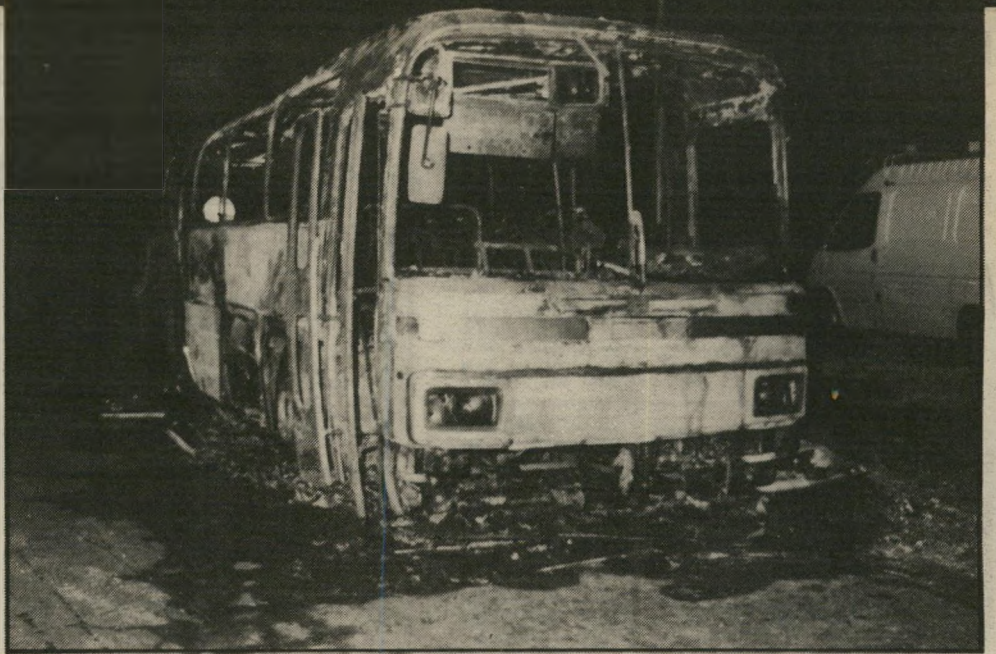
האוטובוס אחרי הסינוע הוא לא דיבר על התקרית...