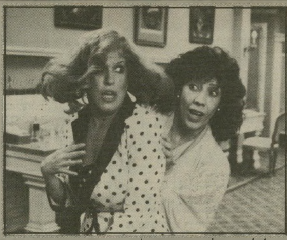
לילי טומלין ובט מידלר - הצעקנות חוגגות

מידלר וטומלין מרסות בכל העוצמה על מיתרי האישיות הציבורית שלהן ואילו הבימאי ג'ים אברמס, שהיה שותף עם האחים צוקר לקומדיית סטורמות כמו טיטה נעימה וסודי בחולט, עושה בדיקום מה שעשה איתם, אבל במידה הרבה יותר קטנה של הצלחה.