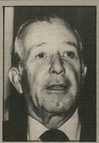
ראש-מטה לשעבר ריגן הילדה שהוא הכי אוהב...

• כיצד היית מוכנה את היחסים ביניכם כיום? הייתי רוצה לחשוב שאנחנו חברים. • היית מופתע בשחרורך לך על כוננתו למנות אותך לאחד התפקידים הבכורים ביותר בימימשל? מופתע? זה היה לי לכבוד, אבל זאת הייתה החלטה מאוד קשה עבורי. קיבלתי את הודעתו של בוש אחרי שכבר החלטתי לעבור לסקטור הפרטי. הכרזתי שאינני רץ עוד למישרת המושל. וזה לא נבע מפחדים או מהערכות-מצב פסימיות. פשוט הרגשתי שכך אני רוצה, שהגיע הזמן.