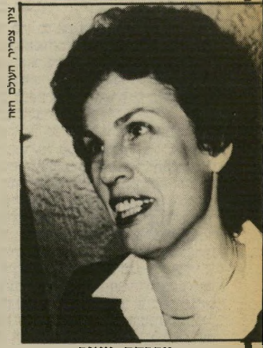
מפכת מאור אוקיי, הנדילי

מי שהיה אז שרההכלכלה, יעקב מרירור, העיד במישפט כי הפריץ ביקשו לסייע לבנק בפיתרון בעיות,