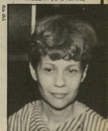
נאשמת מונסה, ועצום עיניים