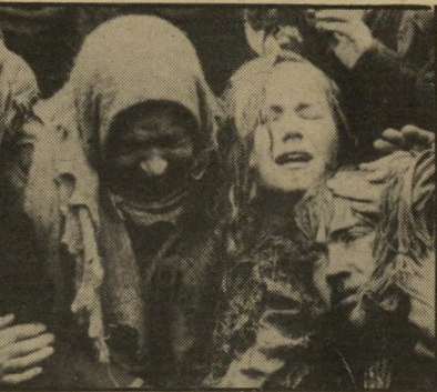
„צא וראה“ - אלם קלימוב חמונה מחרדה

אלא שמדובר כאן בסרט אופנתי וריקני כל-כך, שהדמויות בו אינן מעוררות שום עניין בזכות עצמן. קשה להאמין בקוויד הסופר והמנחה הרוחני, שארלוט ראמפלינג היא קריקטורה של עצמה כאלמנת מיליונר שנרצח ומג רייאן מחליקה כל תפנית מביכה בחיך מאיר עיניים של בת קליפורניה אופטימית. אם יש מי שמתעקש בכל זאת לראות כאן גילגול חדש של הקולנוע האפל, הוא יוכל להיאחז לפחות בנקודה אחת לרפואה: הסרט הוא באמת אפל, צריך לאמץ מאוד את העיניים.