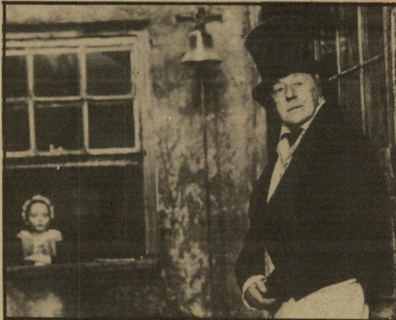
סיר אלק גינס - משחק ברמה טלוויזיונית גבוהה

*** צא וראה (אורלי, ברי-המועצות) — מסה מטילת-אימים על זוועות המילחמה בכיילורוסיה, אחת התמונות המחרירות והמפחית.