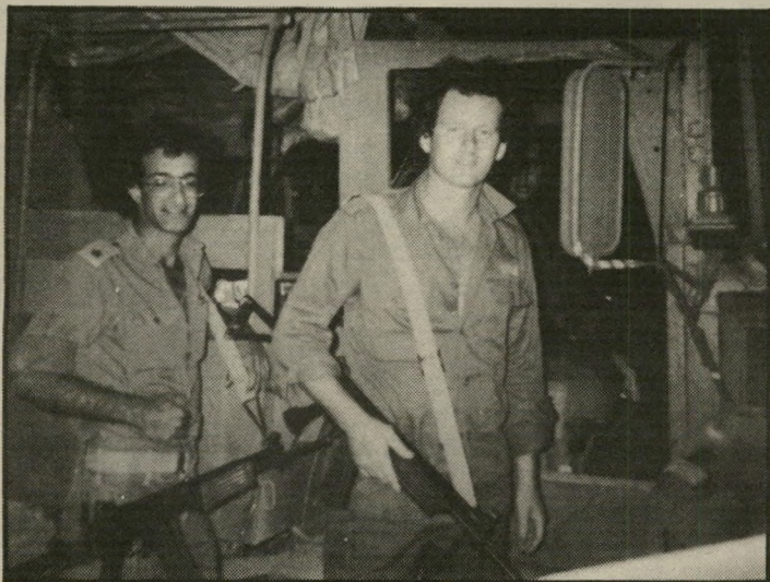
לסלרוט (מימין) וקצין בסיוור 100, אחוזים של שינאה...

ל חיי הייתי מרריך בתנועה, עסקתי באנשים, הוא מספר.