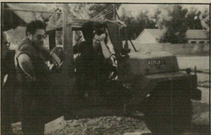
לסלרוט (במכונית) במחנה הפליטים, האינתיפאדה, בעיניו היא ביוון...“