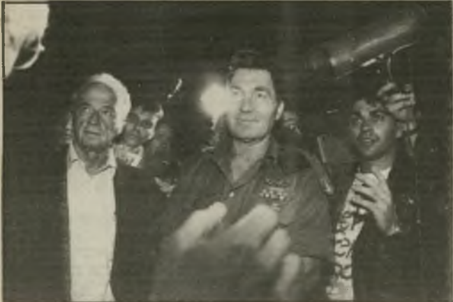
רבין (עם הרמטכ"ל) בנמל-התעופה

אילו אירגן מוסר ישראלי את חטי- פת המטוס, לא יכולה היתה להיות