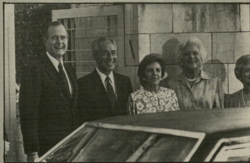
גורג' וברברה בוש עם סוניה ושימרון פרס באוגוסט 1986 , באור אחר לנמר...

אילו היינו אמריקאים לא-יהודיים, אך זה היה נראה לנו? אינני מעלה את השאלה הזאת ככבודך אגב, בגלל בוס... אני מעלה את השאלה מפני שטמונה בה, לדעת, אזהרה חמורה לגבי העתיד. ...אני חושש מפני היום שבו יקום הציבור האמריקאי הלא-יהודי ויצעק: ריז זה לא יכול להימשך!