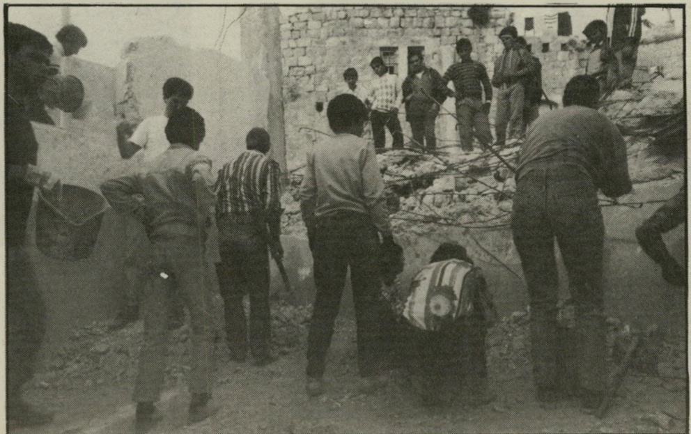
אנשי-הוועד עובדים, בנייה-מקום תהים וכי מדוע שיתרונשו?

נכנסנו לכפר עוד כשהיה נתון בי- עוצר. יצרנו קשר עם כמה צעירים ועם מישפחות של נפגעים." מטרת הוועד: מאבק מישפטי וצי- כורי למען הכפר, וסיוע בבניית בתים למישפחות שנתרו בלא קורת-גג. 42 עצורים, 6 מגורשים ו-40 מפר- טרים ממקומות-עבודתם בישראל זר- כים בסיוע של הוועד. אלה מתרגמים, שוכרים עורכי-דין, מבקרים את העי- צורים ומשתתפים בדיוני בית-המישפט — לעיתים בהתלהבות, לעיתים מתוך עייפות ותיסכול. היא פעילותם זו: בעיקבות התקרית נעצרו 20 תושבים. אחד מהם שכ וטען