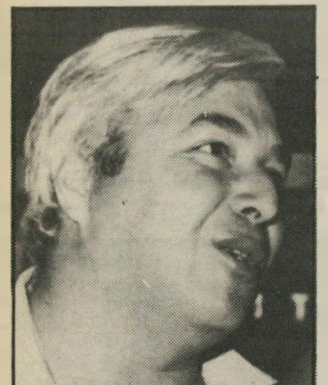
מפעיל-חניונים גרום ל-2000 מכוניות

ב-1 בדצמבר יפתח החניון הגדול בישראל בחוף תל-יבוק, ל-2000 מכר' ניות. הוא תוקם על-ידי בעלי' המיגרשים בגוש הגדול וחברת אחרים.