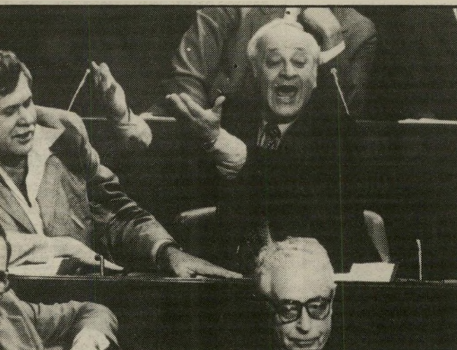
חייב שילנסקי בבנת

כשכבתי למישררהחוק, האמנתי במעשי בלב שלם. לא צפיתי כדיוק מה יקרה, אבל אדם המאמין במעשיו צריך להיות מוכן לשלם את המחיר. אם זה היה מעשה אימפולסיבי, או מחושב? לא יכול לענות לך, קשה. קשה לי לשכוח את התנהגותו של אורי אבנרי בתקופה ההיא. אף־על־פי שחילוקי־הדעות בינינו הם קוטביים, אני זוכר ותמיד אוכזר איך, כשנאסרתי והייתי נרדף ומושמן, ואפילו חברים פחדו לומר לי שלום, נתנו לי אבנרי ועיתונאי יחסם ולבני, למרות שזה היה