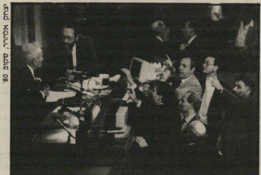
ה"מהומה" בישיבת הפתיחה של הכנסת

כעבור כמה דקות חזר המלצר, וכידו תבילה ענקית של שיירים. "אספתה את כל השיירים של הערב", אמר בפנים קורנות, "שהכלב שלכם יאנה!".